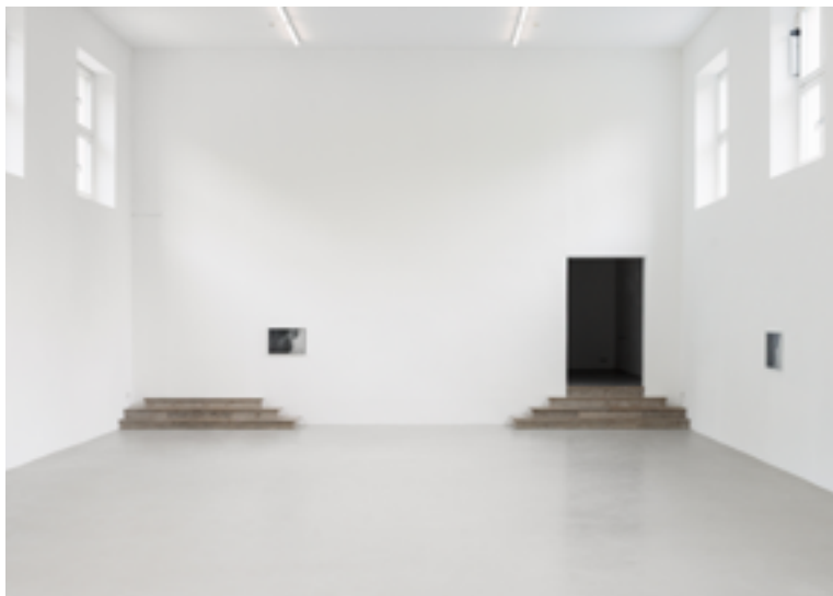
Simon Lässig/Vera Lutz, Romeo's eyes , Installationsansicht, Kunstverein München, 2025, Courtesy: Simon Lässig und Vera Lutz und Kunstverein München e. V., Foto: CL/Lutz/Lässig

Dem uneinholbaren Bild geht Vera Lutz im letzten Raum auf andere Weise nach und setzt mit The Happyness Experiment eine weitere Klammer um die Ausstellung. Die Videos hat sie mit den Camcordern aufgenommen, mit denen sie auch projiziert werden. Die Geräte, die für den massenhaften Hausgebrauch entwickelt wurden, stehen auf Stativen frei im Kreis angeordnet, so dass der Eindruck entsteht, man befände sich inmitten von auf Tischen angehäuftem Kramuri und obsoletter Technik, alten Telefonen, Kassettenrekordern und ausrangierten Tastaturen, die nicht mehr so einfach an gängige Systeme angeschlossen werden können. Die Dinge werden von Taschenlampen angeleuchtet, die die ganze Szenerie in flickernde Bewegung versetzen. In den auf- und abgeblendeten Lichtkegeln scheinen sie nur kurz auf, um im nächsten Augenblick wieder in den Schatten abzutauchen, begleitet vom Sound der durchwühlten Gegenstände, die in den Grauzonen auf ihre Neubestimmung warten.