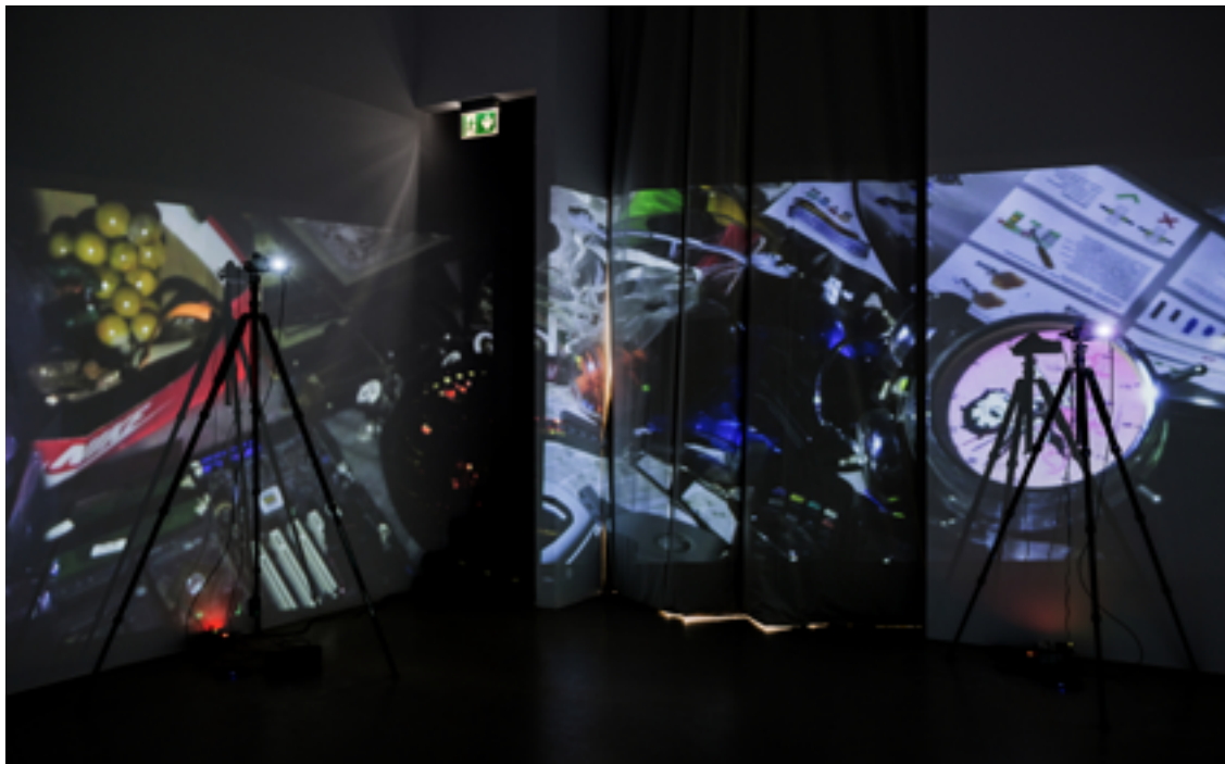
Vera Lutz, The Happiness Experiment , Acht-Kanal-Video, Ton (Loop), 2025, Ausstellungsansicht, Romeo's eyes , Kunstverein München, 2025